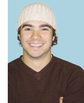
Alexandre Despatie Champion du monde et médaillé olympique en plongeon

« L'appui, la compréhension, la souplesse, l'encadrement et la disponibilité de la part de tous mes professeurs m'ont facilité de beaucoup la tâche, ce qui m'a permis de m'épanouir. »